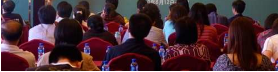
“移民加拿大安居资讯讲座”现场

为进一步拓宽新形势下为侨服务领域，帮助即将移民国外的“准华侨”了解我国相关侨务政策和出入境管理规定，以及移居地海外华侨华人社会情况和安居信息，以便尽快适应新环境、融入新生活，安居乐业，从而在海外展现中国人的良好形象，6月9—17日，由国务院侨办国外司与加拿大华人社区服务团体—加拿大多华会共同主办，北京市、上海市和广东省侨办承办的“移民加拿大安居资讯讲座”先后在上海、北京和广州三市举行。来自北京、上海、广州及附近地区有意移民加拿大的近300人听取了讲座。这是侨务部门首次尝试举办新移民行前教育工作，也是首次尝试与海外华人移民服务团体合作开展为侨服务活动。