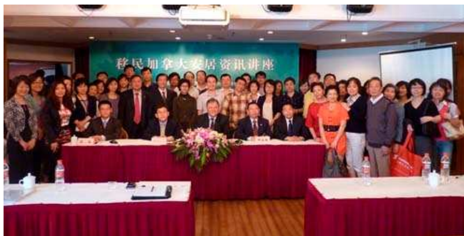
6月9日, 参加“移民加拿大安居资讯讲座”(上海站)的全体听众与工作组合影